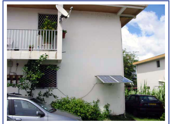
Installation en Martinique