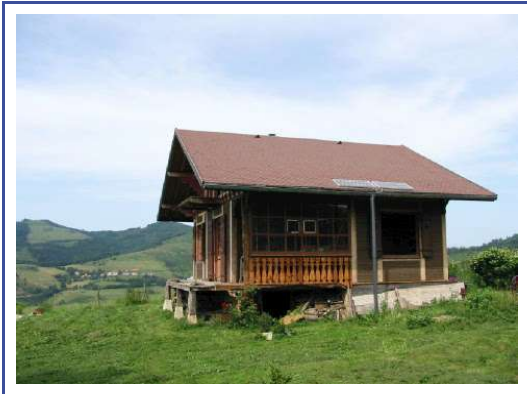
Gîte de montagne

Quelques exemples d'installations en site isolé que nous avons réalisées.