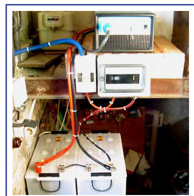
5 - Centrale terminée