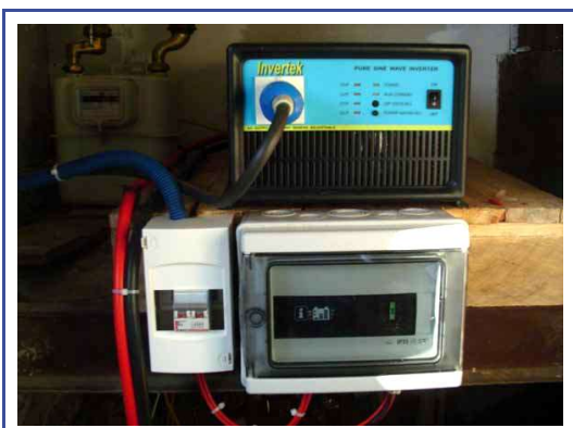
4 - Éléments de régulation et conversion