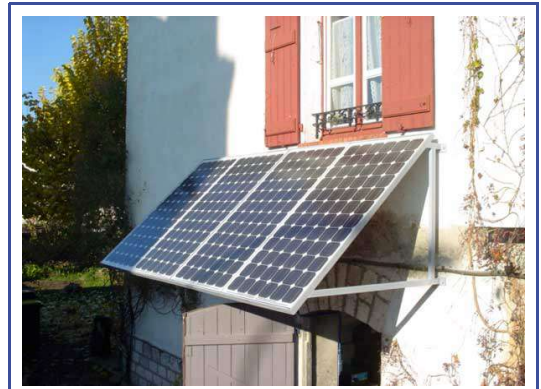
3 - Mise en place des panneaux